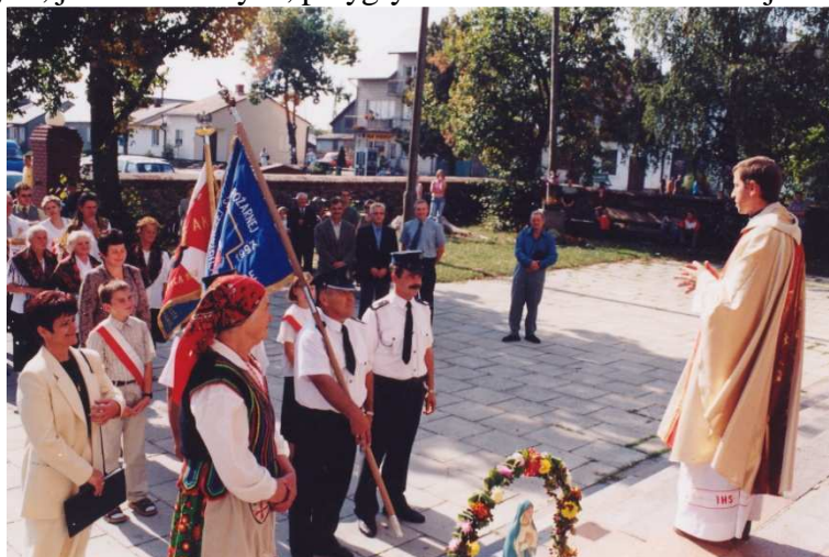
Dożynki – 2004

członków do chóru kościelnego. Wśród starszego pokolenia żywe są jeszcze wspomnienia dotyczące istnienia przy OSP orkiestry dętej. Trudno jednak napisać coś konkretnego o jej istnieniu. Z pewnością uświetniała swoją grą uroczystości strażackie, przeglądy, obchody świąt państwowych, jak i kościelnych, przygrywała do tańca w czasie majówek i zabaw.