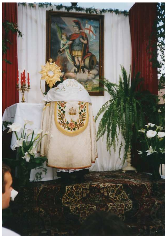
Ółtarz Strażacki na Boże Ciało – Garwolin 2002