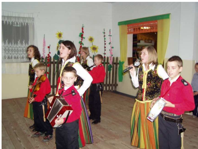
Założenie UL - 2004