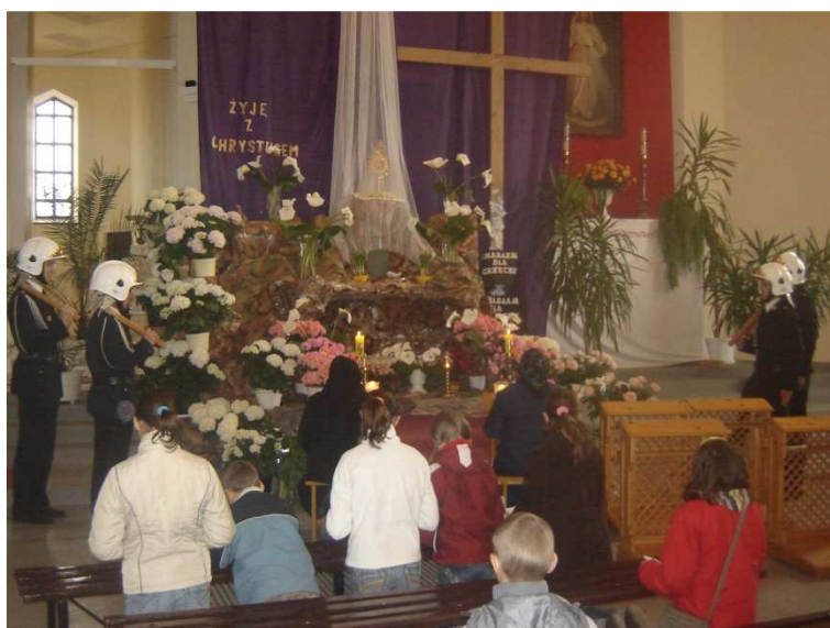
Adoracja na Wielkanoc - 2007