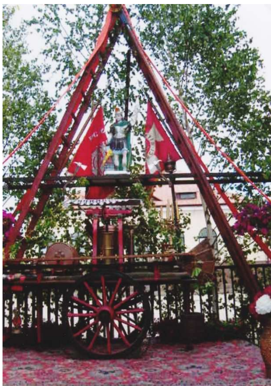
Ółtarz na Boże Ciało – Garwolin 2006

Działa tu najstarsza OSP w powiecie. Jednostka powstała w 1875 roku 11 . Uczestnicy aktywnie we wszystkich świątach i uroczystościach organizowanych na terenie miasta. Przy straży działa sekcja miłośników starego sprzętu strażackiego, która była jednym z inicjatorów Mazowieckich Zawodów Sikawek Strażackich. Od 2003 drużyny męskie i żeńskie z całego województwa rywalizują w strojach z początków pożarnictwa i z ręcznymi sikawkami. Niektóre z nich wyprodukowano w końcu XIX wieku. Jednostki pokazują na żywo historię i bogate tradycje strażackie, podjeżdżają końmi i starymi wozami z epoki. Corocznie odbywa się barwne widowisko na stadionie MOSiR-u dla całej społeczności powiatu gromadzące, z imprezami towarzyszącymi, tysiące widzów. W remizie jest izba pamięci a przy jednostce działa orkiestra strażacka.