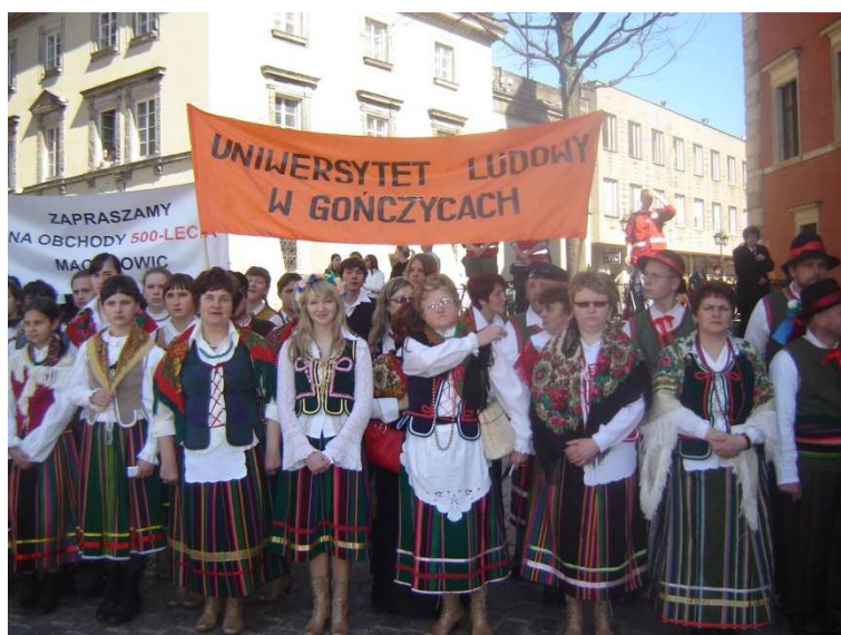
Warszawa – 2007