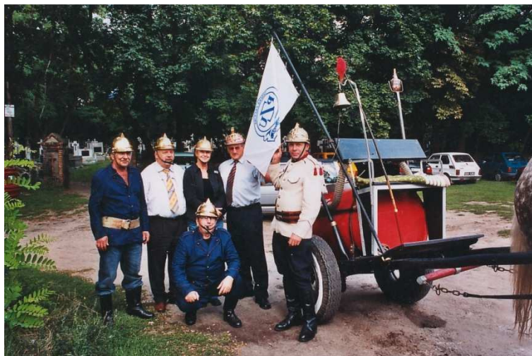
Dożynki w Borowiu w 2004 roku – OSP Garwolin