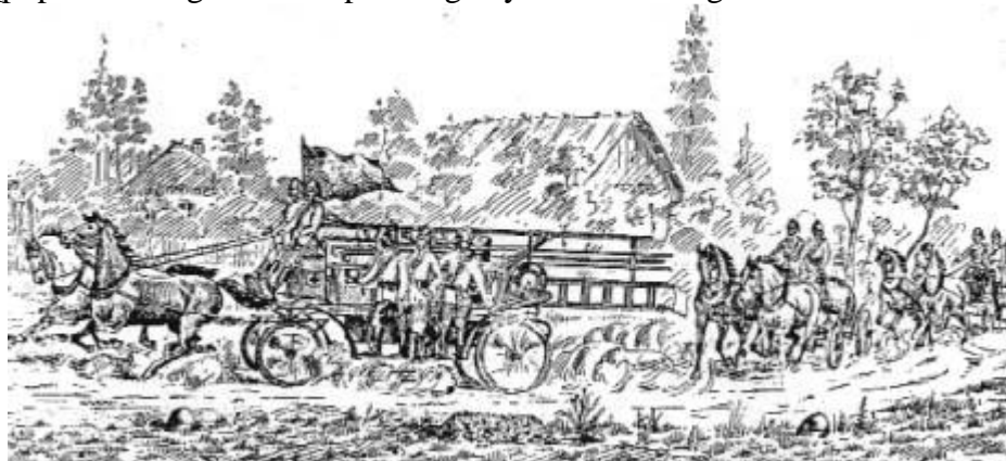
Straż pożarna w akcji

samorządową podejrzewając, iż będzie ona nie tylko ośrodkiem walki przeciwpożarowej, ale wystąpi przeciw zagrożeniom polskiego życia narodowego.