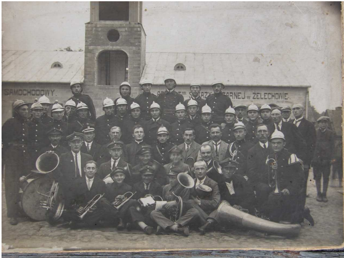
Orkiestra Żelechów w okresie międzywojennym