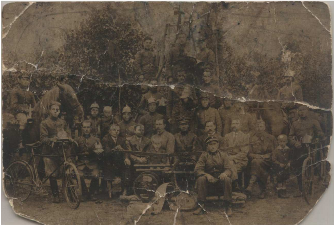
OSP Stary Pilczyn – 1934