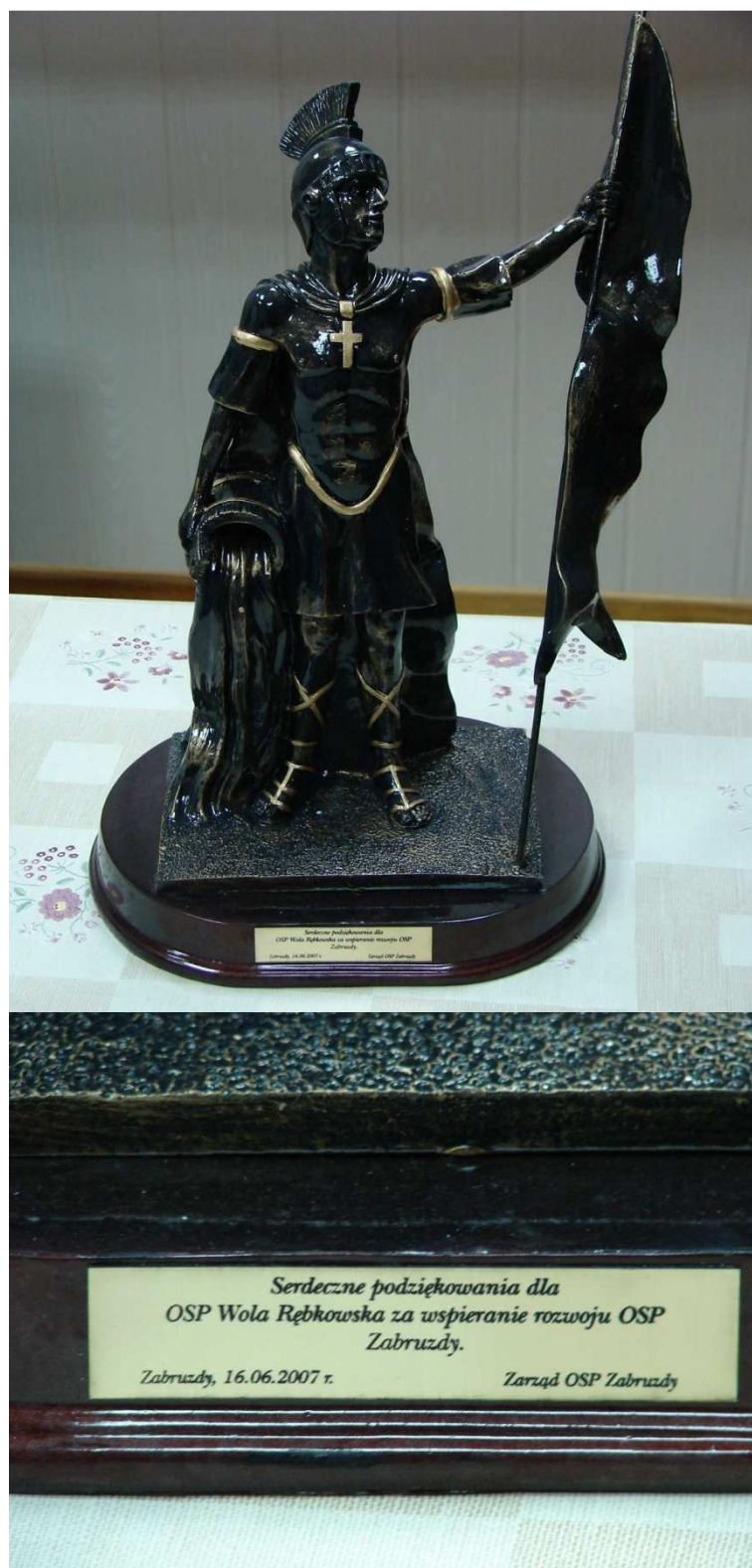
O współpracy między strażami świadczy następująca statuetka.

Od 1999 roku obchodzony jest Międzynarodowy Dzień Strażaka (ang. International Firefighters' Day, skrót IFFD) - międzynarodowe święto strażaków, 4 maja, w dniu św. Floriana, oficjalnie na pamiątkę śmierci 5 australijskich strażaków.