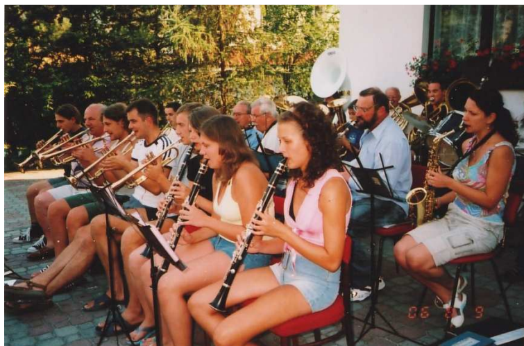
Orkiestra Trąbki na wczasach, koncert dla miejscowej ludności, jezioro Białe koło Włodawy, członkowie są rozpoznawalni przez miejscową ludność

Orkiestra w Pilawie powstawała razem ze strażą, czyli działała już w latach dwudziestych ubiegłego wieku. Zdobyła wiele nagród na przeglądach orkiestr dętych.