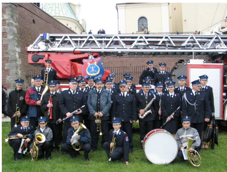
Orkiestra z Łaskarzewa

Orkiestra w Pilawie powstawała razem ze strażą, czyli działała już w latach dwudziestych ubiegłego wieku. Zdobyła wiele nagród na przeglądach orkiestr dętych.