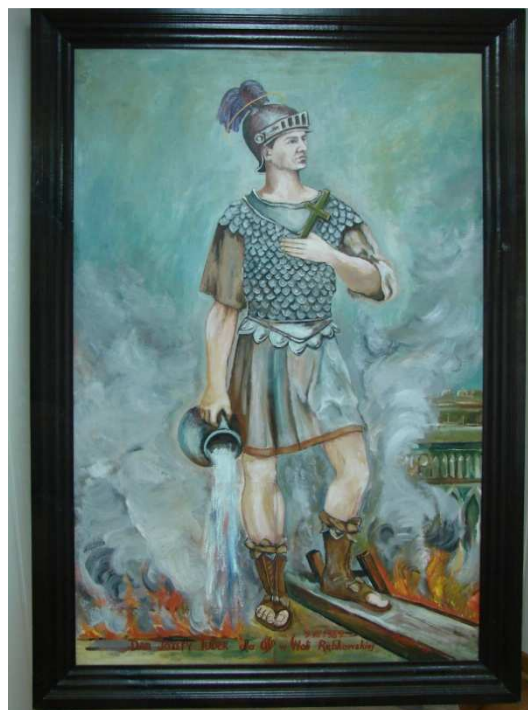
Obraz namalowany przez p. Jerzego Jarzabka z Garwolina – OSP Wola Rębkowska

Strażacy swoje święto obchodzą 4 maja 8 w dniu św. Floriana. Jest to tradycyjna data, chociaż w okresie międzywojennym sporadycznie spotyka się inne terminy obchodu tego święta. Zainteresowanych odsyłam do książki Bogusława Ulickiego Święty Florian .