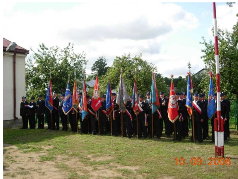
Poczty sztandarowe na 80-leciu

W 2006 roku straż w Starym Pilczynie obchodziła 80-lecie.