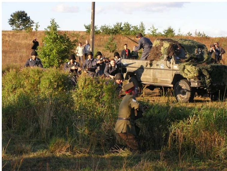
Potyczka wrześniowa – 2005