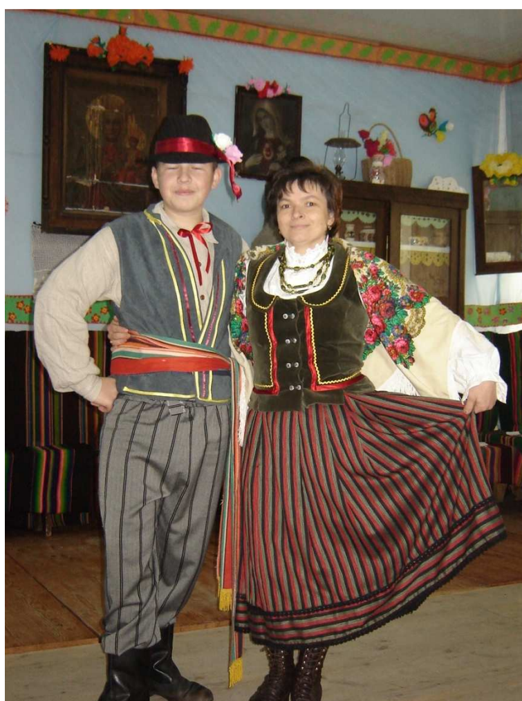
Wesele sprzed stu lat - 2006

OSP Kaleń-Grabniak powstała w 2000 roku a w 2002 otrzymała sztandar. Straż w Kownacicy została założona w 1954 roku a w 1997 roku oddano do użytku remizę.