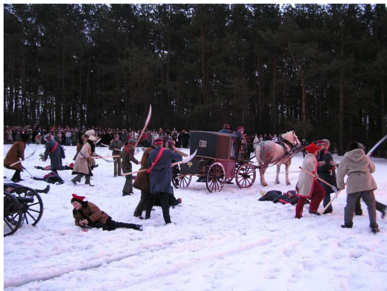
Napad na dyliżans – 2005