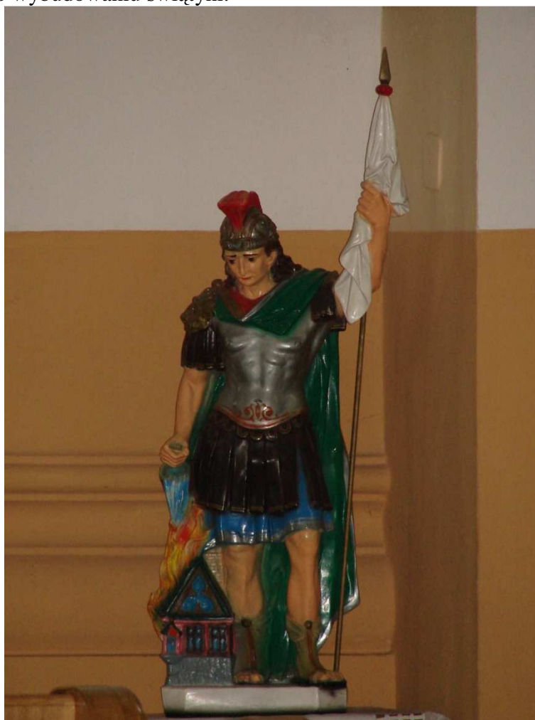
Święty Florian w kościele w Górznie

wiozące relikwie świętego na Wawel. Konie tak długo nie chciały się ruszyć z miejsca, aż zdecydowano o wybudowaniu świątyni.