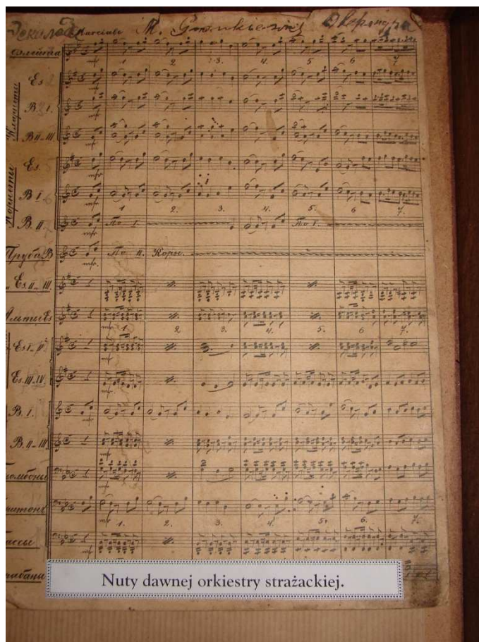
Nuty dawnej orkiestry strażackiej – izba pamięci w Żelechowie