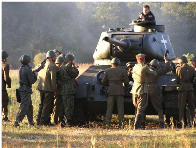
Potyczka wrześniowa - 2005