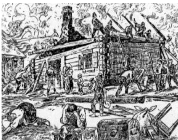
Pożar w drewnianej zabudowie najczęściej kończył się tragicznie.

Wobec rosnącej ilości masowych pożarów ( ciasna zabudowa, budynki drewniane kryte strzechą i gontami) powstaje oddolny ruch strażacki. Walka z pożarami staje się więc najwyższą potrzebą budzi solidarność społeczną Polaków i pilną potrzebę organizacji w terenie.