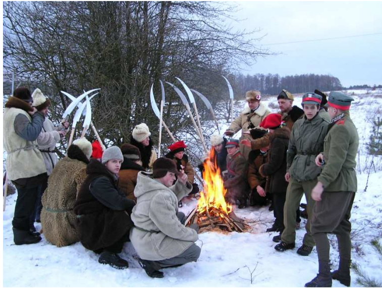
Przed napadem na dylizans - 2005