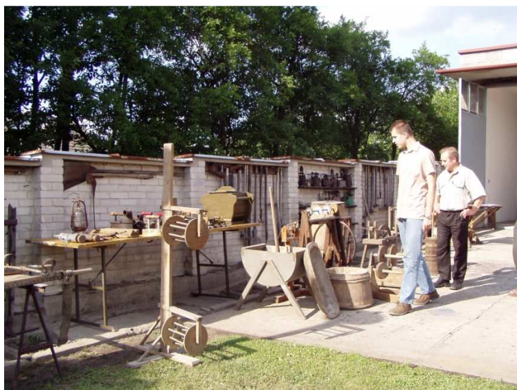
U Gózdzia na podwórku