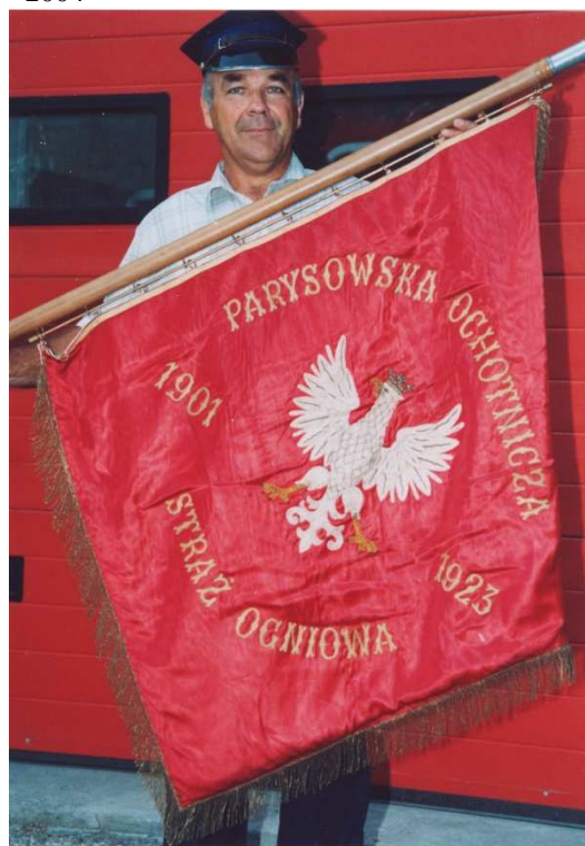
Pierwszy sztandar z 1927 roku.

Wystawiane na scenie amatorskie przedstawieni teatralne, często z udziałem miejscowego Koła Gospodyń Wiejskich, „sztuczki” stwarzały okazję do rozrywki dla całej społeczności. Wprawdzie repertuar zespołu amatorskiego nie był specjalnie wymagający, bo zazwyczaj składały się nań jednoaktowe „komedyjki”, to jednak wywierał on wpływ na kształtowanie gustów, odczuć estetycznych i etycznych Parysowian.